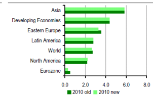
Chart 2: Global GDP forecasts 2010, old versus new

Note: 'Old' refers to 2 March 2009